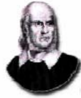
Friedrich Ludwig Jahn